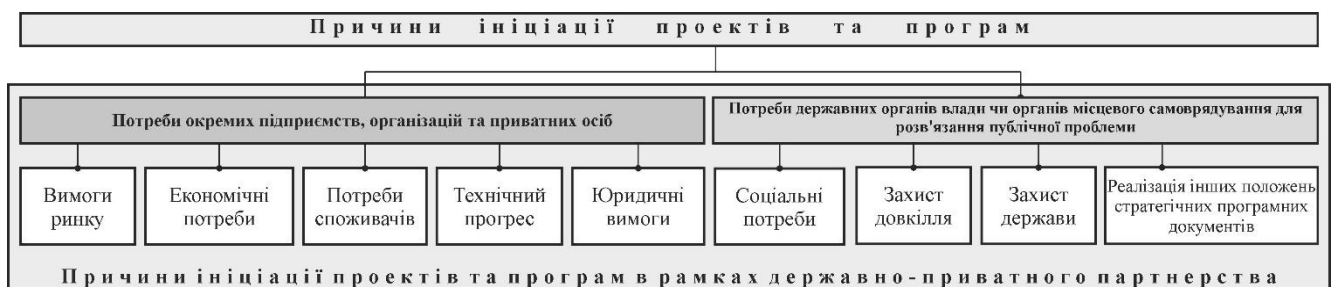
Рис. 1. Класифікація причин ініціації проектів та програм

Отже, традиційні принципи класифікації причин ініціації проектів, розглянуті у попередніх дослідженнях [1], потребують доповнення загальною метою ініціації проектів в публічній сфері – а саме: необхідністю втручання державних органів влади чи органів місцевого самоврядування для розв'язання публічної проблеми з застосуванням проектного підходу. Доповнена класифікація причин ініціації проектів та програм наведена на рис. 1, розробленому авторами.