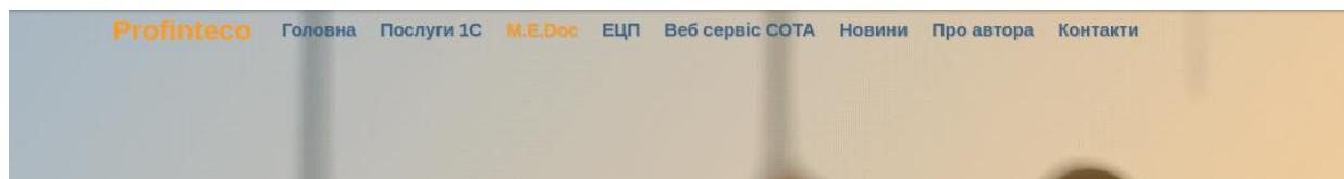
Рис. 1. Результат файлу header.html.twig

{% set БЕМ_block = 'app' %} <div class="{{ БЕМ_block }}"> {% include '@blogger/include/header.html.twig' with {'show_dlog_hero': false} %} {% include '@blogger/include/pages/medoc.html.twig' %} <main{{ main_layout_attributes.addClass(БЕМ_block ~ '__content') }}> <div class="main-layout__inner"> {{ page.content }} {{ page.sidebar_first }} </div> </main> {% include '@blogger/include/footer.html.twig' %} </div>